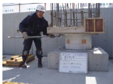
P C a 版据付