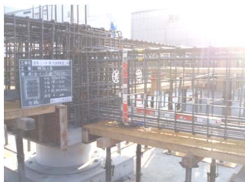
1 S L 配筋組立